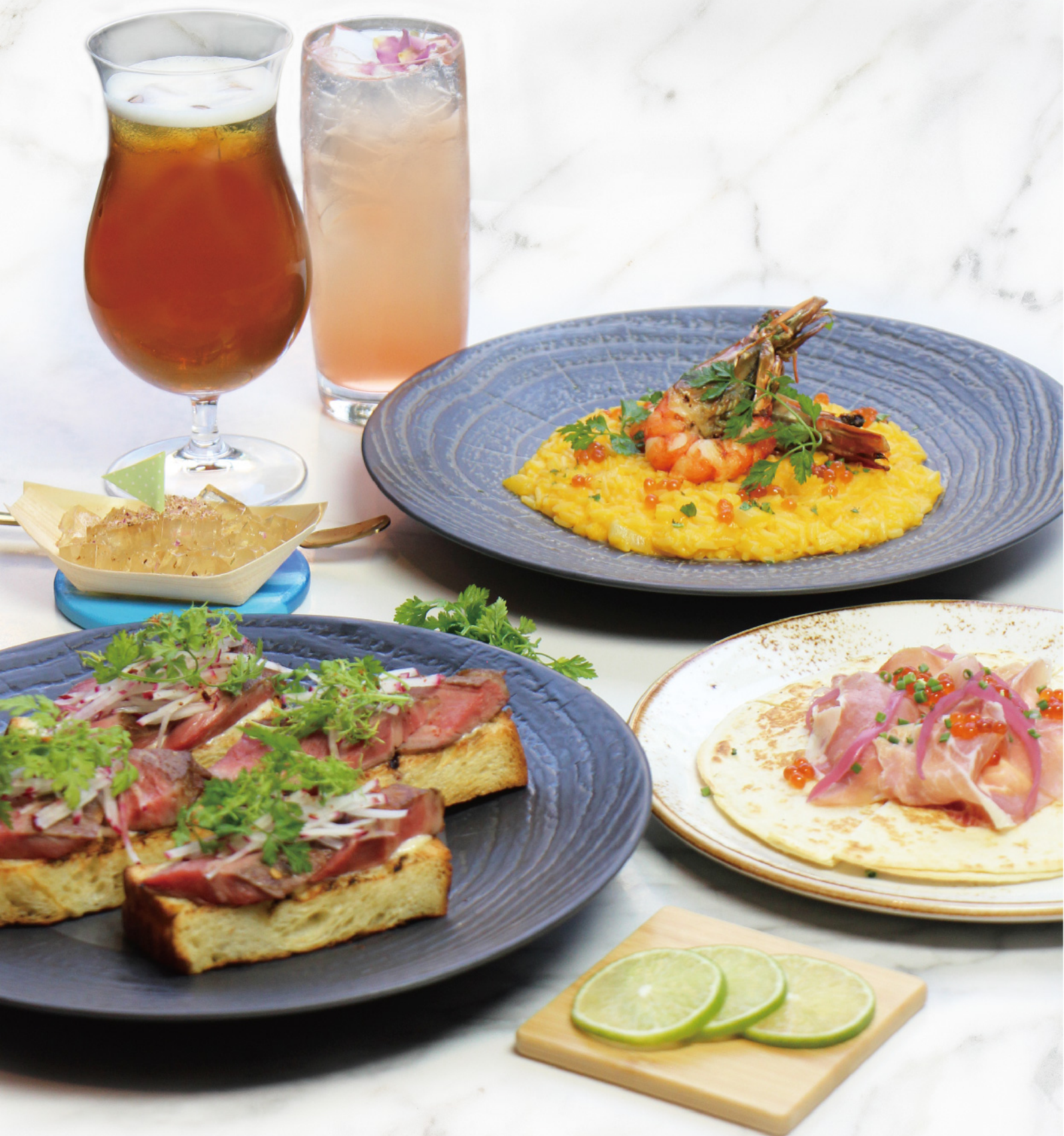
Set Meal For Two